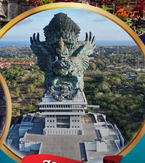
สวนวิชนู