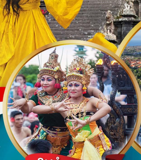
ระบำเกอจก